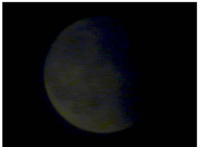
Abb. 7: Kein modernes Gemälde mit Pastellfarben, sondern ein Foto mit sehr kurzer Belichtungszeit (1/200s), auf dem erst eine Bildbearbeitung den Mond deutlich sichtbar werden lässt (23:55 MESZ).