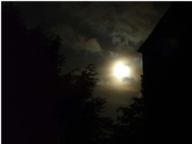
Abb. 8: Stimmungsbild gegen Ende der nicht mehr wahrnehmbaren Halbschattenphase (00:38 MESZ).

Inzwischen sind einige weitere Leute vom Alten Zoll zum Rheinufer heruntergekommen. Als der Mond kurz vor Mitternacht wieder einmal hinter einer Wolke verschwindet, macht sich Aufbruchsstimmung breit, die Kameras werden eingepackt. Und kaum ist dies geschehen, kommt der Erdtrabant wenige Minuten vor Ende der Kernschattenfinsternis erstmals für längere Zeit zum Vorschein. Die Geräte werden nicht mehr ausgepackt; wir schauen uns den Mond, der jetzt hinter dünnen Zirren steht, einfach nur in Ruhe an. Auch der verbleibende Beleuchtungsdefekt zu Beginn der ausgehenden Halbschattenphase ist gut zu beobachten. Gegen 00:15 machen wir uns schließlich auf den Heimweg. Nachdem ich Angi nach Hause gebracht habe, packe ich das Stativ doch noch einmal aus. Obwohl der Mond noch im Halbschatten steht, ist davon visuell nichts mehr erkennbar. Es ist jetzt ein ganz normaler, extrem tief stehender, von letzten Wolken umspülter Vollmond.