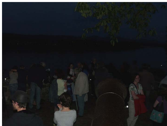
Abb. 3: Viel Interesse an unserer Aktion und gute Laune trotz bewölktem Himmel (22:12 MESZ).

Es ist zu diesem Zeitpunkt noch ziemlich schwül, und es gibt einiges an konvektiver Bewölkung. Nach und nach kommen immer mehr Leute hinzu, kurz nach 22:00 Uhr sind es etwa 70 Personen.