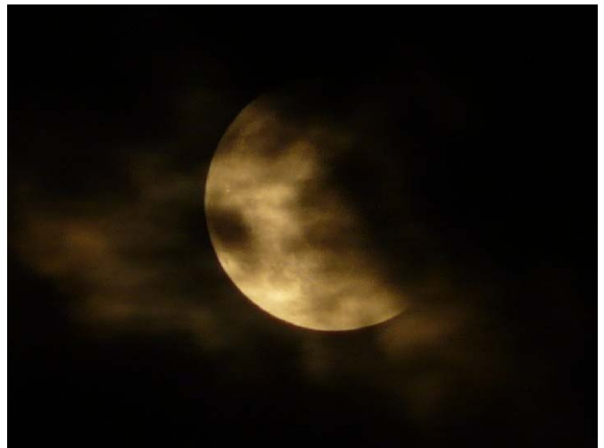
Abb. 6: Der Mond lugt zwischen den Wolken hervor; die rechte Seite steht noch im Kernschatten der Erde (23:42 MESZ). Belichtungszeit 1 Sekunde.

Während noch über das Thema ISS diskutiert wird, taucht mit einem Mal der partiell verfinsterte Mond in einer kleinen Wolkenlücke auf. Jetzt zeigt sich ein Nachteil unseres Beobachtungsortes: Südlich des Alten Zolls stehen hohe, weit ausladende Bäume, welche den bereits weit nach Süden gewanderten Mond halb verdecken. Von der Nordost-Ecke der Bastion ist es noch etwas besser; Angi und ich entschieden uns aber, gleich zum Rheinufer hinunter zu gehen, wo wir bis zum Ende der Finsternis einen freien Blick zum Mond haben werden. Als wir unten ankommen und das Stativ wieder aufgebaut ist, haben die Wolken den Erdtrabanten erneut geschluckt. Kurz darauf lässt er sich wieder sehen, verschwindet wieder, taucht kurz auf ... es bieten sich gerade so die Gelegenheiten für ein paar Fotos und eine kurze Videosequenz.