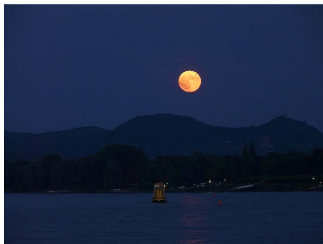
Abb. 2: Mondaufgang über dem Siebengebirge am 26.06.2010 um 22:25 MESZ, aufgenommen am Bonner Rheinufer einige hundert Meter südlich vom Alten Zoll.

Eine Mondfinsternis am blauen Dämmerungshimmel, ob nun partiell oder total, verspricht immer interessante Fotomotive. Das galt hier in Bonn insbesondere für die MoFi am 15.06.2011, sollte doch der total verfinsterte Mond für Beobachter an der Rheinpromenade knapp über dem Siebengebirge stehen. Eine Probebeobachtung anlässlich des Juni-Vollmondes 2010 bestätigte diese verlockenden Aussichten.