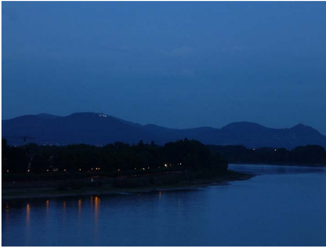
Abb. 4: Das Siebengebirge in der "Blauen Stunde" (22:16 MESZ).

Allmählich macht sich von Westen her der erwartete Aufklärungsbereich bemerkbar, doch zugleich nimmt die niedrige Bewölkung wieder zu; weniger direkt über uns als im Norden und im Süden, wo der Mond steht. Schuld daran ist vermutlich die abendliche Abkühlung, welche jetzt einsetzt und in der feuchten Luft unvermeidlich das Auskondensieren von Wolken zur Folge hat. Trotzdem ist die Stimmung gut, und von den Mitarbeitern der Volkssternwarte wird so manche astronomische Frage beantwortet. Zwischendurch bietet sich immer mal wieder die Gelegenheit zu dem einen oder anderen pastellfarbenen Stimmungsfoto.